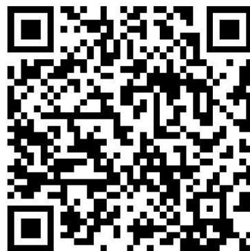
《智慧校园使用指南 (2024)》 在线版

持录取通知书、身份证、专科毕业证书原件到学校报到处进行入学资格审核。因故不能按时报到者应电话、信函向教务处办理请假手续 (0553-5976910), 无故逾期一周不报到者, 取消入学资格。