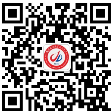
“安徽机电智慧校园” 微信公众号

2024 级新生采用智慧校园迎新报到系统进行线上报到, 所有环节都在网上进行, 请新生务必按步骤完成迎新报到各个环节, 否则报到注册过程会中断, 将影响新生学籍的注册登记。请关注“安徽机电智慧校园”微信公众号, 获取更多智慧校园服务信息。